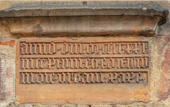
Epitaph zur Grundsteinlegung 1421 (Außenfassade Marktplatzseite); Bild: Manfred Wilhelm (Büro Wilhelm, Amberg)

V.i.S.d.P.: Stadtpfarrer Thomas Helm Kath. Pfarramt St. Martin Pfarrer-Meiler-Platz 1 92224 Amberg Telefon: 09621 / 12455 E-Mail: st-martin.amberg@bistum-regensburg.de www.amberg-st-martin.de www.facebook.com/basilika.st.martin.de